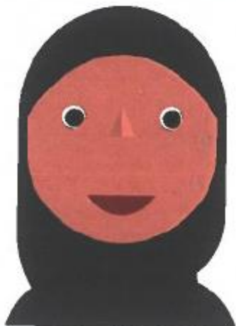
Myriam 42 jaar